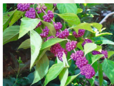
Callicarpa bodinieri 'Profusion'