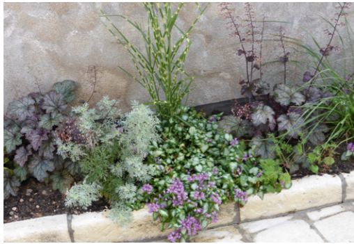
Monts : Artemisia arborescens 'Powis castle', Heuchera 'frosted violet', Miscanthus sinensis 'Zebrina', Lamium maculatum 'White Nancy'.