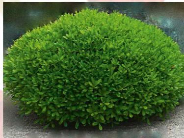
Pittosporum tobira 'nana'