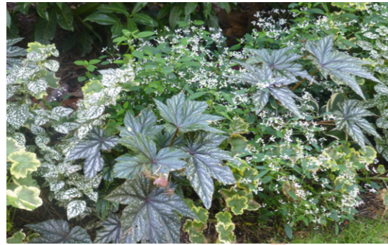
Les Carrés Fleuris des graines Voltz : Begonia 'Gryphon', Euphorbe 'Diamond Frost', Geranium 'Mrs Pollock', Hypoestes 'pronto blanc'.