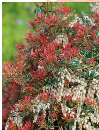
Pieris 'Little Heath variegata'

Santoline argentée, Weigelia 'Magical Rainbow' (caduc), Pieris 'Flaming Silver', Pieris 'Little Heath variegata', Fusain fortunei 'Emerald and gold', Fusain fortunei 'Emerald Gaity'