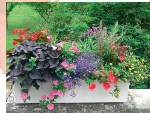
Villedomain - Lobelia erinus, Ipomée batatas 'Black Tone', Pétunia 'Easy Wave Pink' et Corail.