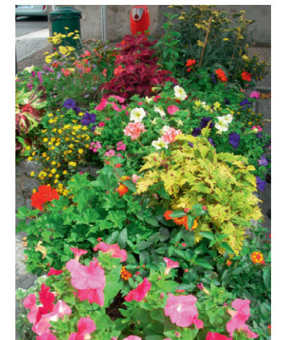
Pocé-sur-Cisse - Coleus 'Vancouver', Coleus 'Peter Wonder', Lantana orange, Pétunia, Pelargonium hortorum.