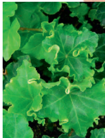
Hedera helix 'Parsley Crested' Feuillage frisé, croissance rapide

Le lierre couvre sol le plus utilisé est Hedera helix . Il trouvera sa place au pied des arbres et arbustes, à la condition de maîtriser son développement et d'éviter qu'il monte trop dans l'arbre. Il maintient l'humidité, limite l'évaporation du sol, évite les stress thermiques des racines des plantes supérieures, maintient la vie du sol... Il faut seulement de temps en temps limiter son développement et le couper à la cisaille à plat pour favoriser de jeunes pousses vertes tendres.