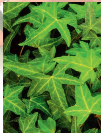
Hedera helix 'Pedata' Feuillage découpé, croissance rapide