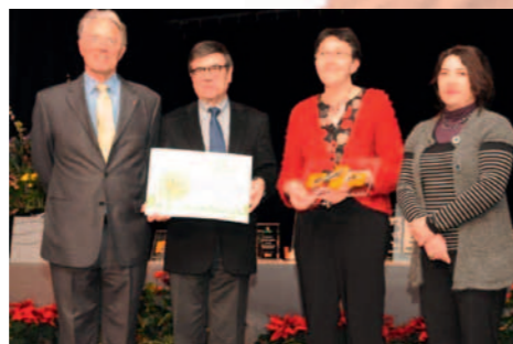
La délégation du Conseil général et de la SHOT

En 2011, l'Indre-et-Loire compte : 42 communes labellisées sur 277 78 fleurs attribuées sur l'ensemble du département.