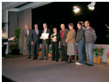
La délégation d'Avoine

C'est en présence du Secrétaire d'Etat au Tourisme que le Conseil National des Villes et Villages Fleuris a remis le 15 février 2012 à Paris sa 4 e fleur à la ville d'Avoine ainsi que le Trophée du Département Fleuri au département d'Indre-et-Loire.